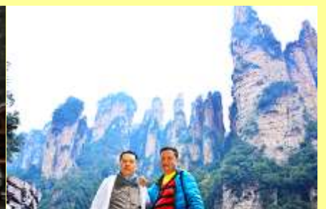
ชมจุดชมวิวลีเฟ็ก้าแก้ว

โปรแกรมเสริมที่ 1 โปรแกรมเที่ยวชมอุทยานภูเขาอวตารแบบสั้นที่ไม่ขึ้นลิฟท์แก้ว (ผู้เข้าร่วมขั้นต่ำ 15 ท่าน) ใช้เวลาประมาณ 2-3 ชั่วโมง อัตราค่าบริการท่านละ 400 หยวนหรือ 2,000 บาท นำท่านเที่ยวชมจุดชมวิวลำธาร