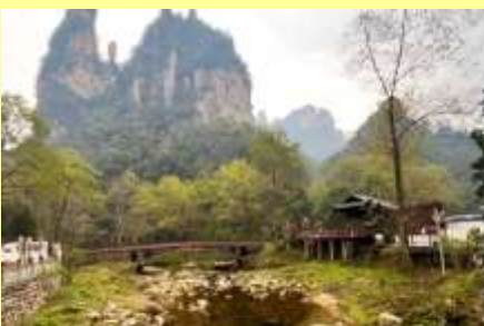
จุดชมวิวจินเปียนชี่

หลังอาหารเช้าให้ท่านพักผ่อนตามอัธยาศัยในโรงแรม หรือ ท่านสามารถเลือกซื้อโปรแกรมเสริม OPTIONAL TOUR รายการใดรายการหนึ่ง ซึ่งเป็น โปรแกรมท่องเที่ยวที่ไม่ได้รวมอยู่ในรายการท่องเที่ยว ซึ่งมีด้วยกัน 3 โปรแกรม ได้แก่