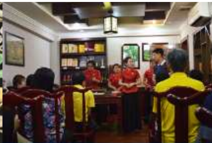
ร้านใบชา