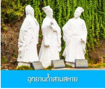
อุทยานก้าสามสหาย