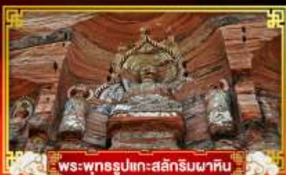
พระพุทธรูปแกะสลักหินผาศิน