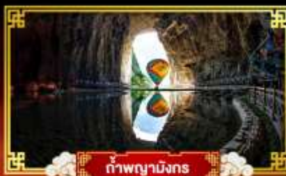
ถ้ำผานางมกร