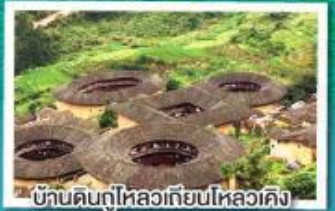
บ้านดินกู่ไหลวเทียนไหลวเค็ง