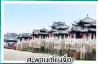
สะพานเซียงจิว