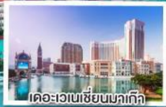
เดอะเวเนเซียนมกเก๊า