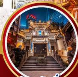
วัดหลัวฮัน