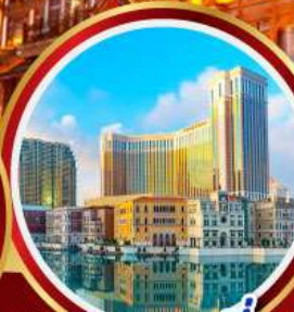
เดอะเวเนเชียน