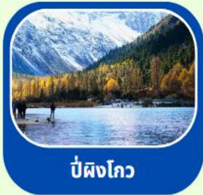
ป่ผิงโกว

เดินทาง : 17-22 พค // 20-25 มิย 8-13 กค 2568