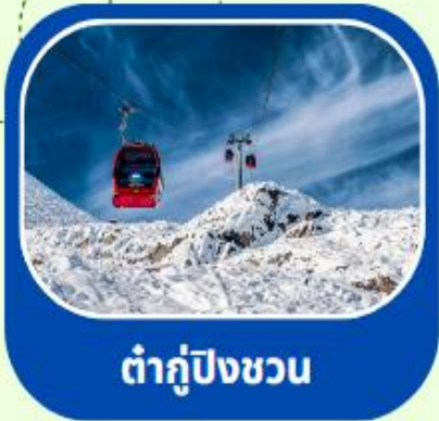
ต้ากู่ปิงชวน

ทัวร์ไม่ลงร้าน+ไม่ขายออฟชั่น+บินFullService