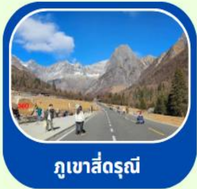
ภูเขาสีดรุณี