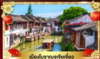
เมืองโบราณซูเจียเจียว

สนุกเต็มพิกัด "สวนสนุกดิสนีย์แลนด์เซี่ยงไฮ้"