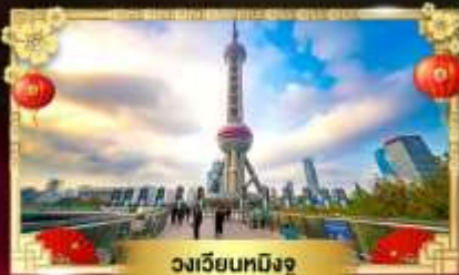
วงเวียนหมิงจู่