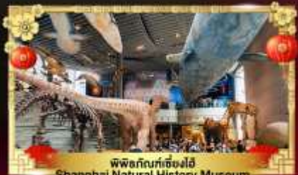
พิพิธภัณฑ์ธรรมชาติ Shanghai Natural History Museum