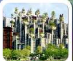
"อาคารพันต้นไม้"