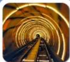
"ลอดอุโมงค์เลเซอร์"

เซี่ยงไฮ้ • ล่องเรือเมืองโบราณจู่เจียเจี้ยว • นั่งรถไฟลอดอุโมงค์เลเซอร์ POP MART • วัดจิ่งอัน • อาคารพันต้นไม้ • ตลาดรอยปีเงินหวงเมี้ยว อิสระช้อปปิ้งเต็มวัน หรือ จะซื้อตั๋วเที่ยวดิสनीแลนด์