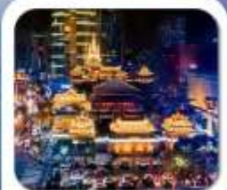
"วัดจิ่งอัน"