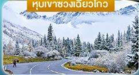
เจ็ททูเพนด้า IFS