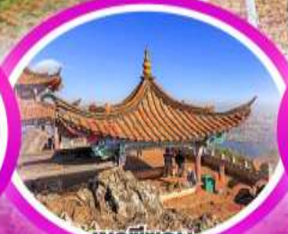
เวาซีซาน