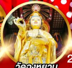
วัดฉงหยวน