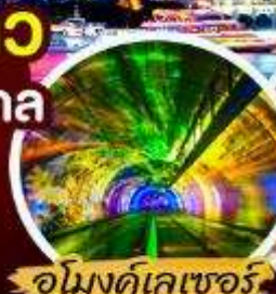
อู๋มองด์เลเซอร์