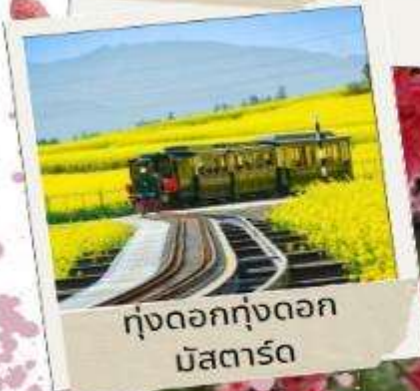
ทุ่งดอกทุ่งดอก มัสตาร์ด