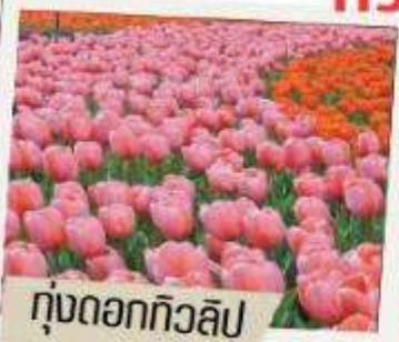
ทุ่งดอกทิวลิป

ทัวร์คุณหมิง ชมหุบเขาซากุระ ทุ่งทิวลิป ทุ่งดอกมัสตาร์ด 5วัน4คืน MU