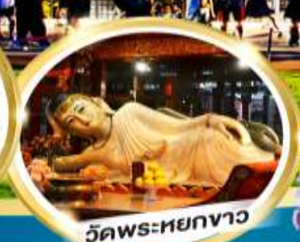
วัดพระหยกขาว