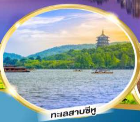
ทะเลสาบซีหู