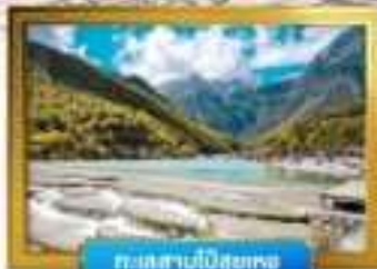
ทะเลสาบป๋อซูหยง