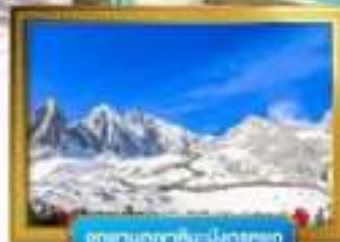
อุทยานภูเขาหิมะมังกรหยก

เดินทางโดยสารการบินจีนนำอิสเทิร์นแอร์ไลน์