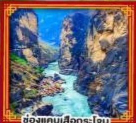
ช่องแคบเสื่อกร-โง