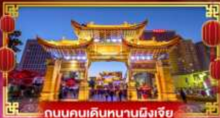
ถนนคนเดินหนานผิงเจีย