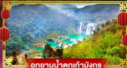
อุทยานน้ำตกเก้ามังกร