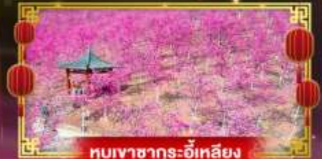
หุบเขาซาถูระอี่หลียง