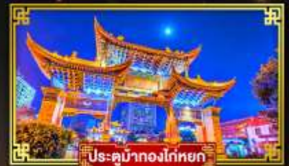
ประตูมังกรโก่หยก