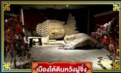
เมืองใต้ดินหวงผู่จิ้ง

“กำแพงหิมะ”...สิ่งมหัศจรรย์ของโลก พระราชวังต้องห้าม อดีตพระราชนิเวศน์หลวงสุดยิ่งใหญ่