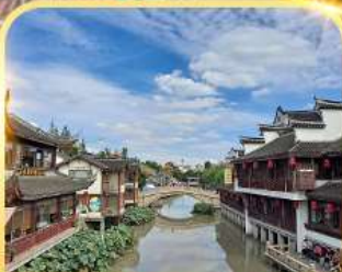
เที่ยวเมืองโบราณซีเปา