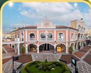
ช้อปปิ้ง FLORENTIA VILLAGE OUTLET