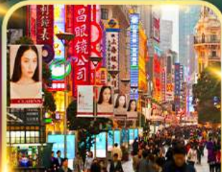
เดินเล่นถนนหนานจิง