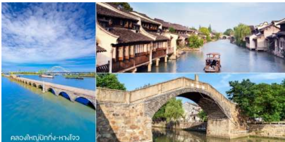
คลองใหญ่ปักกิ่ง-หางโจว

กลางวัน บริการอาหารกลางวัน ณ ภัตตาคาร พิเศษ! ชาหมูเชียงไฮ้