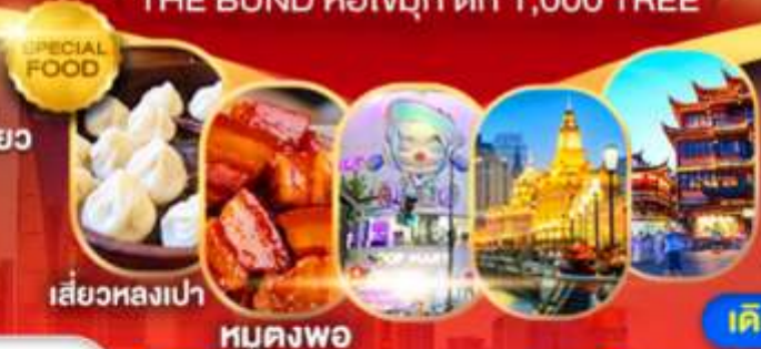
เสี่ยวหลงเป่า