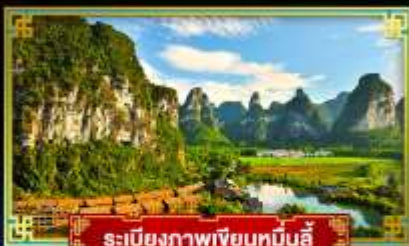
ระเบียบภาพเขียนหมินอี