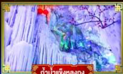
ตำนานเงี้ยวหลงกวง

"เที่ยว 2 มณฑล กวางซี-กัชโจว" สุดอลังการ น้ำตก 2 พรมแดน แหล่งท่องเที่ยวระดับ 5A