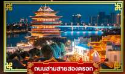
ถนนสามสายสองตอรก