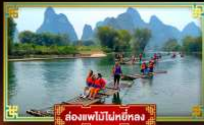
ล่องแพไม้ไผ่หยอง