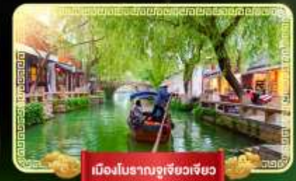
เมืองโบราณซูเจียวเจียว