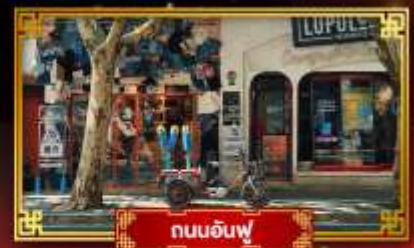
ถนนฉินฟู่