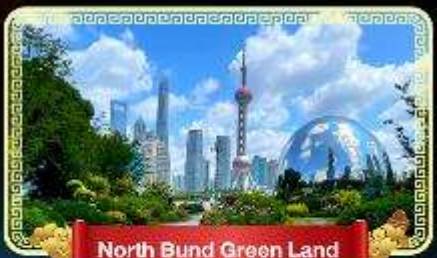
North Bund Green Land