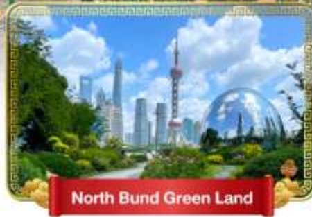
North Bund Green Land