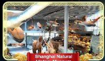
Shanghai Natural History Museum