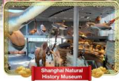
Shanghai Natural History Museum