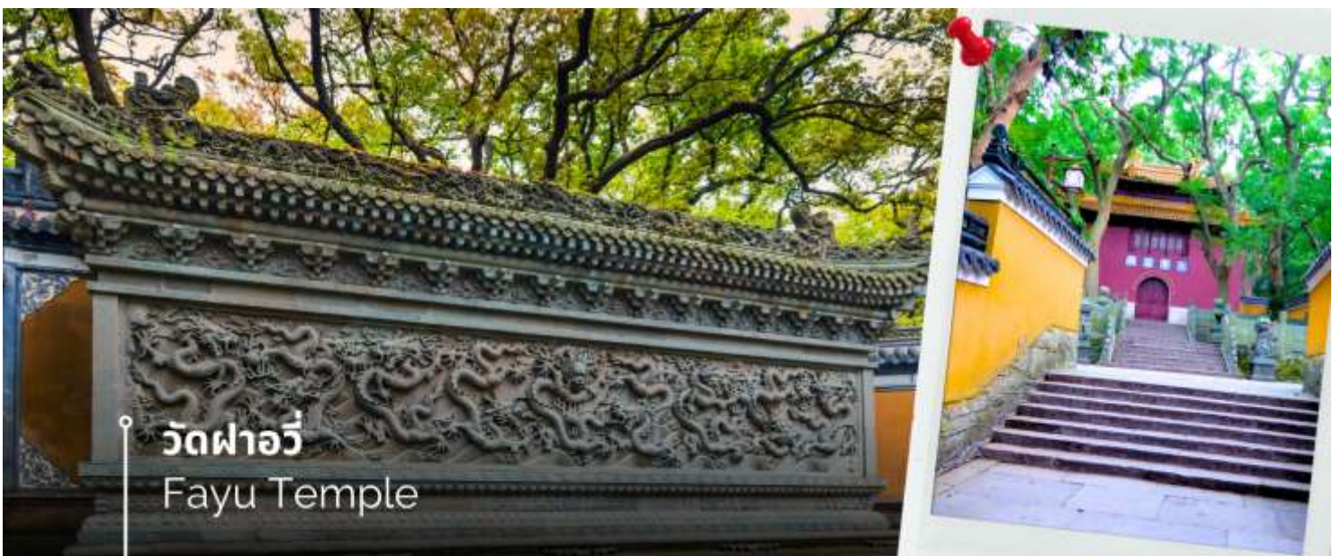
วัดผาอวี Fayu Temple

หลังอาหารนำท่านนมัสการองค์พระโพธิสัตว์ เจ้าแม่กวนอิมไม่ยอมไป วัดไผ่สีม่วง อีกหนึ่งวัดที่ตั้งอยู่บนเกาะผู้โถวซาน ซึ่งที่นี่ได้รับสมญานามว่า “เกาะพระโพธิสัตว์” เพราะเป็นวัดเล็กๆ ที่อยู่ติดกับทะเล สาเหตุที่เรียกว่าวัดไผ่ม่วง เพราะว่าบริเวณนั้นมีต้นไผ่สีม่วงขึ้นเยอะ และความพิเศษอีกอย่างหนึ่งคือ ต้นไผ่สีม่วงจะมีในเกาะแห่งนี้ที่เดียว สำหรับไฮไลท์เด็ดของที่นี่คือ “เจ้าแม่กวนอิมไม่ยอมไป” ซึ่งวัดนี้มีประวัติมาอย่างยาวนาน ตั้งแต่สมัยราชวงศ์ถัง (ค.ศ.961) ซึ่งเป็นยุคที่พุทธศาสนามีความเจริญรุ่งเรืองในแผ่นดินจีน พระโพธิสัตว์ศักดิ์สิทธิ์องค์นี้ไม่ยอมรับอัญเชิญไปประดิษฐานที่ญี่ปุ่นตามการอัญเชิญของหลวงพ่อยุ้ยเอ้อ ภิกษุชาวญี่ปุ่นที่มาศึกษาพระธรรม องค์ท่านจึงได้ดลบันดาล