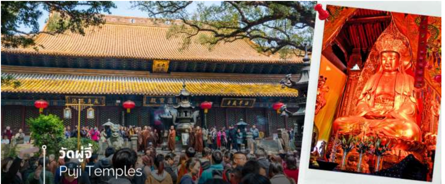
วัดผู้จี Puji Temples

นำท่านสู่ วัดผู้จี วัดในตำนานที่ควรมาเป็นอย่างยิ่ง โดยไฮไลท์ของวัดนี้คือ องค์พระโพธิสัตว์ที่มีเทพลักษณะเป็นชาย เป็นองค์ที่ชาวจีนทั่วโลกให้ความเลื่อมใสศรัทธาสูงสุด ซึ่งวัดผู้จีเนี่ย เป็นวัดใหญ่ที่สุดบนเกาะที่มีประวัติเก่าแก่นับพันปี แต่เดิมเนี่ยเป็นวัดเล็ก แต่ผ่านร้อนผ่านหนาวมา ตั้งแต่ยุคราชวงศ์ซ่ง หยวน หมิง และชิง จนกระทั่งได้รับพระราชทานนาม “ผู้จี” จากจักรพรรดิคังซีแห่งราชวงศ์ชิง ส่วนในรัชสมัยของจักรพรรดิหย่งเจิ้งก็ได้รับการบูรณะครั้งใหญ่จน