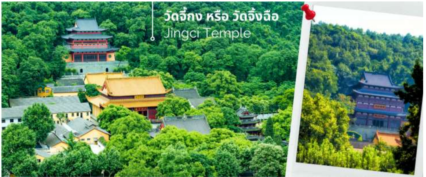
วัดจิ่งก หรือ วัดจิ่งฉือ Jingci Temple

สวนชาหลงจิ่ง และถ่ายรูปกับสวนใบชาหลงจิ่ง และจิบชา ก่อนนำท่านไปซื้อป๊ิง หังโจว เอาท์เลต ที่มีแบรนด์ดังมากมาย ทั้งแบรนด์จีน แบรินด์ฮ่องกง หรือแบรนด์อินเตอร์มากมาย เป็นจุดให้ท่านได้ละลายเงินหยวนได้อย่าง