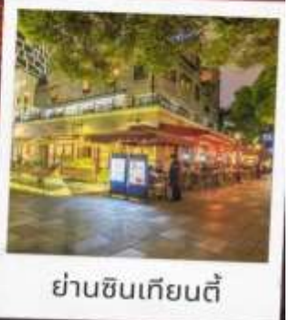
ย่านซินเทียนตี้