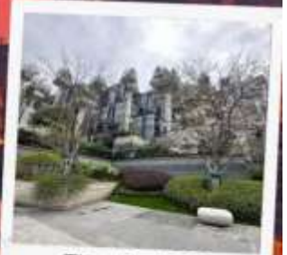
Tian An 1,000 Trees Square