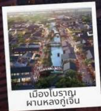
เมืองโบราณ ผานหลงกุเจิน