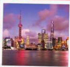
ชั้นหอไข่มุก