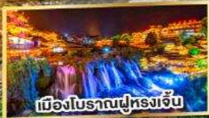
เมืองโบราณฟูหลงเจิน