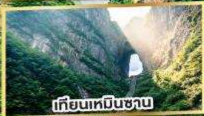
เทียนเหมินชาน