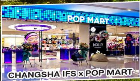
CHANGSHA IFS x POP MART