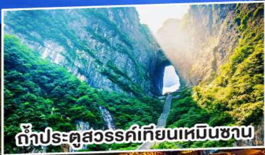
ถ้ำประตูสวรรค์เทียนเหมินชาน

สัมผัสมนต์ขลังฟูหรงเจิน พิษิตระเบียงแก้วเทียนเหมิน