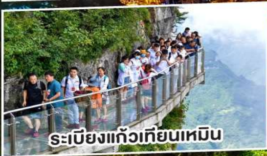
ระเบียงแก้วเทียนเหมิน