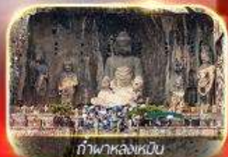
ถ้ำพางหลงเหมิน