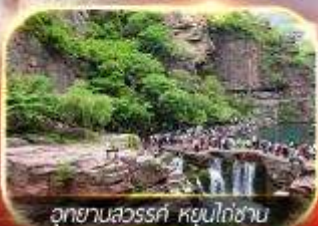
อุทยานลั่วหลิน หุบเขาเขียว