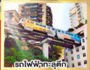
รถไฟฟ้ากะลุติ๊ก