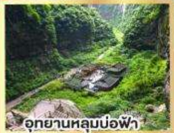
อุทยานหลุมบ่อฟ้า