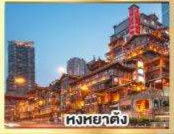
หงหยาดิ่ง