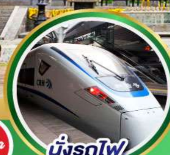
บั้งรถไฟ