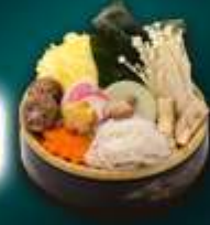
ชาบูเห็ด

★★★★★ พักหรูระดับ 5 ดาว ฟรี!! น้ำหนักกระเป๋า 20 kg.