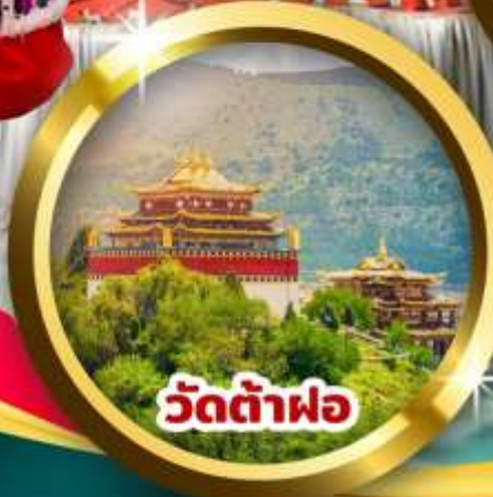
วัดต้าฝอ