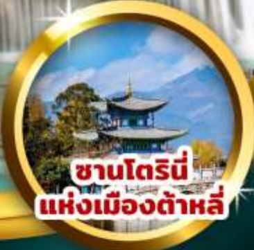
ซานโตรินี แห่งเมืองต้าหลี่