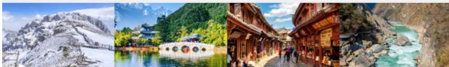
ภูเขาหิมะสีอ๋า