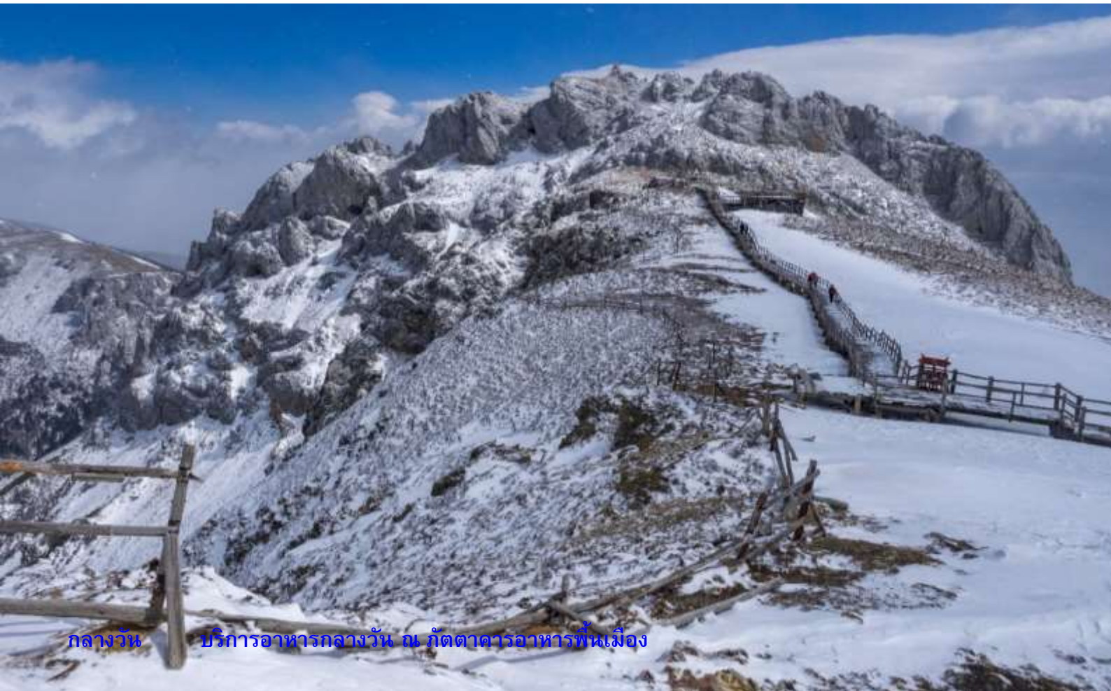
กลางวัน บริการอาหารกลางวัน ณ กัศตาคารอาหารพื้นเมือง

นำท่านนั่งกระเช้าขึ้นสู่ยอด ภูเขาหิมะสีอซ่า (Shika Snow Mountains) ถือเป็นภูเขาอันศักดิ์สิทธิ์ของชาวทิเบต จุดพักระหว่างทางเพื่อเปลี่ยนกระเช้าจะมีทุ่งหญ้าเลี้ยงจามรี ส่วนจุดท่องเที่ยวหลักของที่นี่บนยอดจะมีความสูงถึง 4,500 เมตร และเต็มไปด้วยหิมะอันสวยงามปกคลุมเกือบตลอดทั้งปี เดินลัดเลาะไปตามทางเดินไม้ที่ทอดยาวสุดสายตาจะเห็นวิวเมืองแซงกรี-ล่า ทะเลสาบนาปาไห้ และไฮไลท์ที่พลาดไม่ได้ “ซุ้มป้ายอธิษฐาน” ถูกประดับด้วยธงมนต์ตราหลากสีปลิวไปตามสายลม ซึ่งทิวทัศน์ของภูเขาแห่งนี้จะเปลี่ยนแปลงไปตามฤดูกาลต่างๆ พบกับท้องฟ้าสีครามและหญ้าสีเขียวช่อ่มในฤดูใบไม้ผลิ มีดอกอาซาเลียผลิบานอวดสีสดใสในช่วงฤดูร้อน เห็นภูมិประเทศที่ย้อมด้วยสีแดงในฤดูใบไม้ร่วง และเห็นยอดเขาหิมะที่พร่างพรายในฤดูหนาว ซึ่งด้านบนสุดของภูเขาสีอซ่าจะมีทะเลสาบลึกลับ “Spiritual Rhino” ซ่อนอยู่ภายในป่าดิบ เชื่อกันว่าจะมีแรดโผล่ออกมาช่วงพระจันทร์เต็มดวง ใกล้กับภูเขาหิมะสีอซ่าจะสามารถมองเห็นทิวทัศน์ของภูเขาศักดิ์สิทธิ์อีก 8 แห่ง ตัดกับทิวทัศน์ของอาคารบ้านเรือนสไตล์ทิเบตแบบดั้งเดิม รวมค่ากระเช้าไป-กลับ