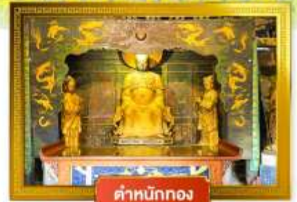
ตำหนักทอง