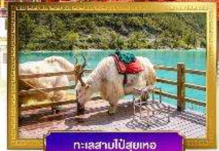
ทะเลสาบไป๋สุ่ยเหอ