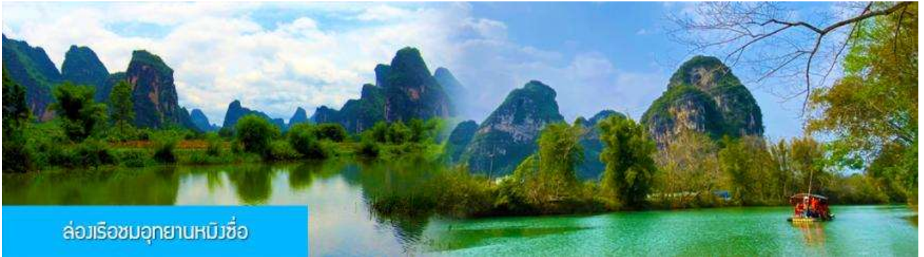
ล่องเรือชมอุทยานหมิงชื้อ