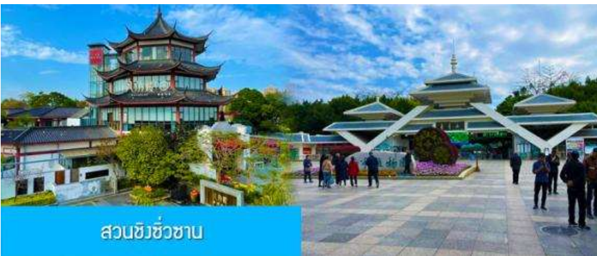
สวนชิวชิวซาบ

อิสระอาหารมื้อเย็น เพื่อความสะดวกในการเดินช้อปปิ้ง ลิ้มรสอาหารท้องถิ่นหลากหลายรสชาติได้ตามอัธยาศัย พักที่ UNIVERSAL HOTEL ระดับ 4 ดาวท้องถิ่นหรือเทียบเท่าในเมืองหนานหนิง