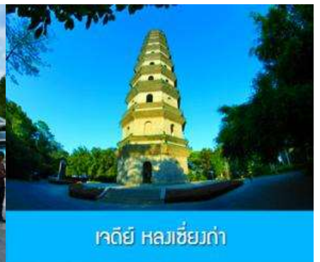
เจดีย์ หลวงเซียงก่า