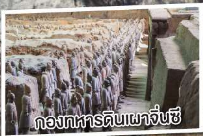
กองทัพดินเผาจิ๋นซี