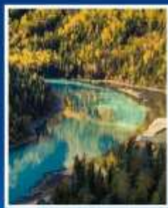
ทะเลสาบมังกรหลับ