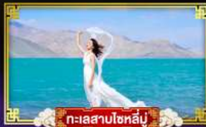
ทะเลสาบโซหลัน