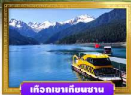
เทือกเขาเทียนชาน