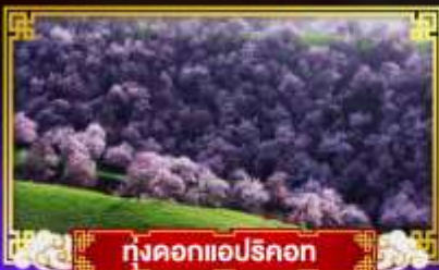
ทุ่งดอกแอปริคอต