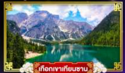
เทือกเขาเทียนชาน