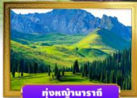
หุบภูเขานาราตี