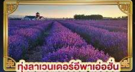
ทุ่งลาเวนเดอร์อิฟาอ้อฮัน