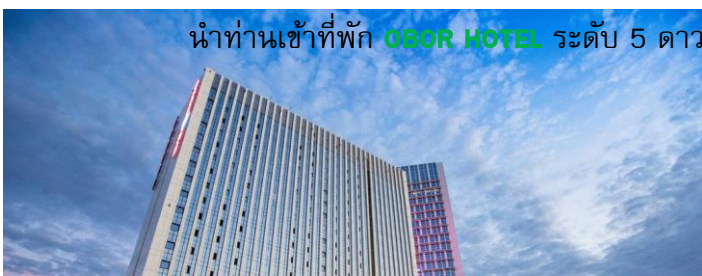
นำท่านเข้าพัก OBOR HOTEL ระดับ 5 ดาว หรือ เทียบเท่า

ในเขตทะเลทราย และในซินเจียง เดือน เมษายน-พฤษภาคม พระอาทิตย์จะตกดิน 19.00 – 20.00 น เดือนกรกฎาคม-สิงหาคมพระอาทิตย์จะตกดินประมาณ 21.00-22.00 น.ส่วนเวลาที่ท่องเที่ยวจึงทำได้