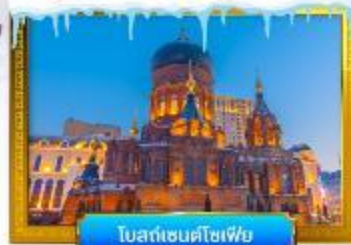
เทศกาลหิมะโซเฟีย