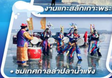
• ชมเทศกาลสาปปลาน้ำแข็ง