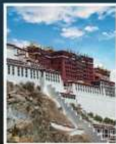
พระราชวังโปตาลา