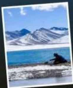
ทะเลสาบน้ำมู่ชั่ว