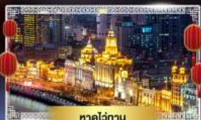
หาดวี้ถ่าน