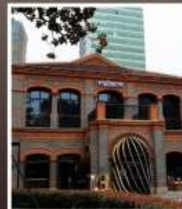
ย่านเฟิงเซินหลี่

รับฟรี!! ประกันสุขภาพ และ อุบัติเหตุ 2 ล้านบาท