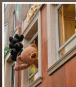
ถนนอันฟู่