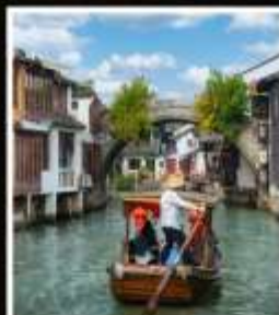
เมืองโบราณ จูเจียเจี้ยว