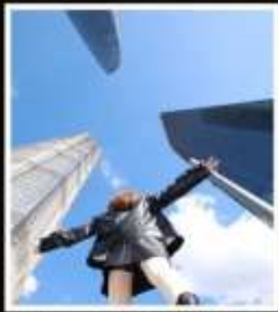
เช็กเมบู 3 ตึกใหญ่ แห่งเซี่ยงไฮ้