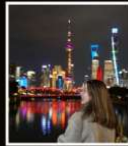
SHANGHAI (CLASSIC NIGHT)